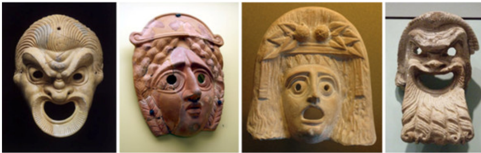
Maschere del teatro greco antico