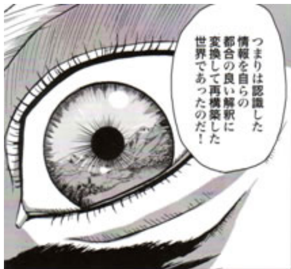
Figura 5: Il prete ha rivelato a Fritz la verità sul mondo: «In pratica, un mondo ricostruito manipolando le conoscenze acquisite secondo un' interpretazione di comodo», recita la vignetta. Da Nigentekina , amari ningentekina .

In quel momento, il prete si congratula con lui e, assumendo le fattezze di Nietzsche, gli dice: