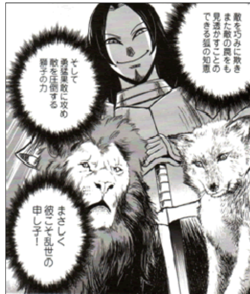
Figura 10: Rappresentazione allegorica delle virtù del Principe: la forza del leone e l'astuzia della volpe. Al centro, Cesare Borgia.

Lo sforzo di fornire un quadro esaustivo delle vicende storiche si contrappone, però, al prevalere di una logica di mercato che, dovendo rivolgersi a un pubblico giapponese poco avvezzo alla storia italiana, favorisce la leggibilità dell'opera condensando, o addirittura omettendo, alcuni momenti chiave. Le ultime pagine del manga, infatti, offrono in tutta fretta al lettore i nuovi scenari politici che nel frattempo si erano delineati intorno al Machiavelli: la disfatta dell'esercito francese, la fuga di Pier Soderini e il rientro a Firenze della famiglia dei Medici, con la conseguente rimozione immediata di Machiavelli dal suo incarico. Lontano dalle lotte di potere, Machiavelli inizia la stesura del Principe , dando