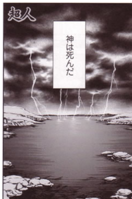
Figura 8: La prima pagina di Così parlò Zarathustra che recita: “Dio è morto”.

Come già accennato a proposito della Commedia , molti titoli della collana della East Press, nel tentativo di rappresentare contesti culturali e temporali molto distanti dal pubblico destinatario, vengono supportati da interpolazioni a scopo didascalico che, per grandi linee, diano un’idea del contesto in cui si ambientano la vita e il pensiero dell’autore, oltre che del sistema valoriale vigente all’epoca. Ne è un esempio la seconda opera che intendiamo analizzare in questa sede, Il Principe di Niccolò Machiavelli, tradotto in giapponese col titolo di Kunshuron (君主論, 2008). Il manga si apre con queste parole, che tentano di offrire al lettore qualche appiglio per meglio comprendere un testo del 1513: