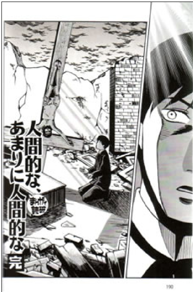
Figura 6: Da Nigentekina, amari ningentekina

Sempre di Nietzsche, esiste la versione a fumetti di Così parlò Zarathustra , in giapponese Tsaratusutora wa kō katatta (ツアラトウストラはこう語った,