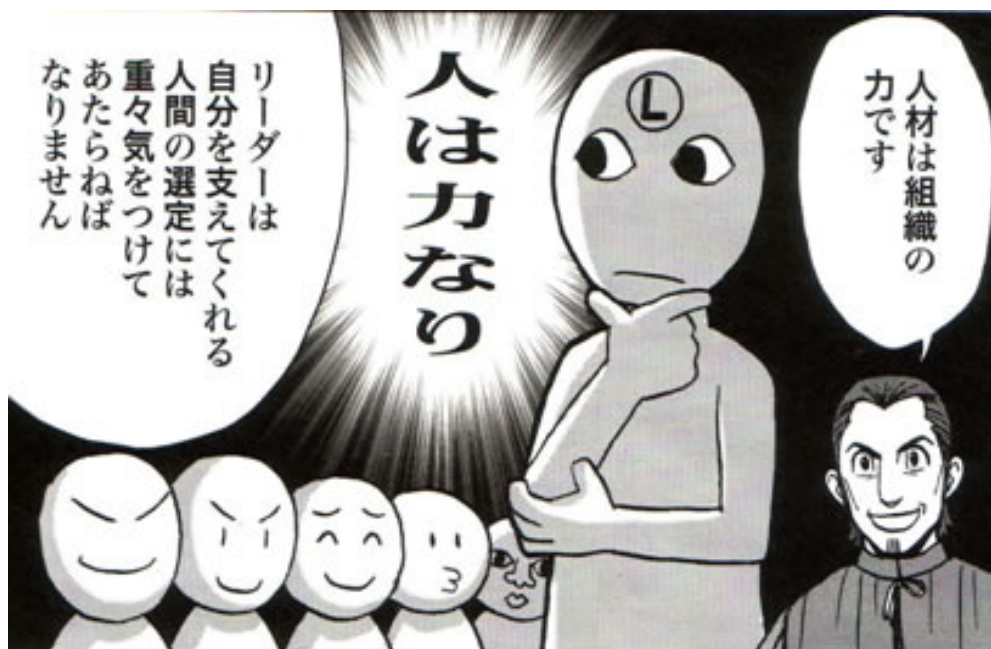
Figura 12: In basso a destra nella tavola compare Machiavelli che lancia ammonimenti al Principe. In questa scena, il leader apprende che le persone dotate di talento possono fornire un supporto determinante per la prosperità del principato.

Questa serie di precetti morali e comportamentali vengono stemperati da una grafica molto buffa, a tratti caricaturale, finalizzata a rendere più intelligibile e di facile approccio il tema generale (Figura 12).