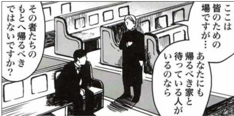
Figura 4: Una scena che raffigura il dialogo tra Fritz e il prete. Da Ningentekina , amari ningentekina .

I molteplici temi che vengono sollevati sono spesso svolti nel corso del manga in forma di dialoghi tra i veri personaggi: si parla di aspirazioni negate, del nuovo ruolo dell'arte, della facoltà di decidere del proprio destino ignorando i desideri degli altri, del labile confine tra ambizione ed egoismo. Il volume contiene anche una rilettura di Genealogia della morale e Al di là del bene e del male , alle quali vengono però dedicate poche pagine rispetto a Umano, troppo umano .